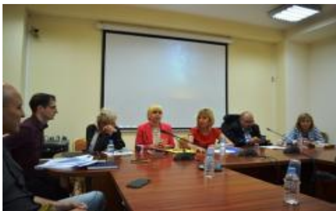
8 юли 2019 г. - Първо учредително заседание

Първото заседание, което се явява и учредително на Съвета, е проведено на 8 юли 2019 г. На заседанието е обявен съставът на Съвета в присъствието на министрите на труда и социалната политика и на здравеопазването, ръководството на Комисията за защита от дискриминация, Агенцията за социално подпомагане, Държавната агенция за закрила на детето, Агенцията за хората с увреждания, Националното сдружение на общините в Република България, представители на организации на и за хората с увреждания, на медии и др.